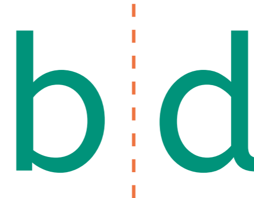
Vision d'une personne non dyslexique

Les deux yeux envoient simultanément deux informations différentes au cerveau. C'est cette confusion qui crée des images miroirs et perturbe sa lecture (d pour le b, etc).